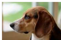
21/07/2016 Cani, migliori amici dell'uomo ma anche impegno e responsabilità