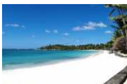
22/07/2016 Vacanze, Italia meta prediletta