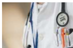
27/07/2016 Il 28 luglio World Hepatitis Day