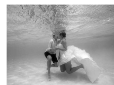
Angsana Ihuru: la destinazione perfetta per pronunciare il "SI" sott'acqua