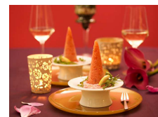
Hotel Beethoven Wien, il posto ideale per soggiornare a Vienna